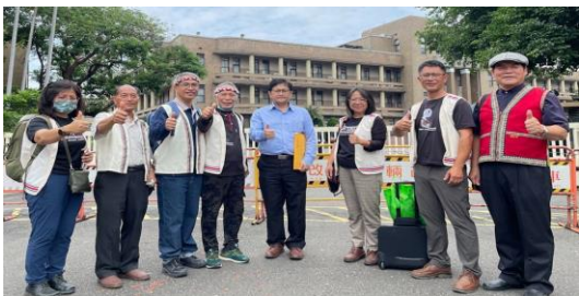
112/5/11西拉雅遞交民族認定申請書